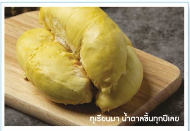
ทุเรียนมา น้ำตาลขึ้นทุกปีเลย