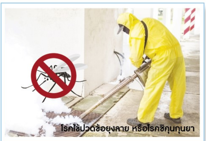
โรคไข้วอดข้อยุ่งลาย หรือโรคชิคุนคุนยา