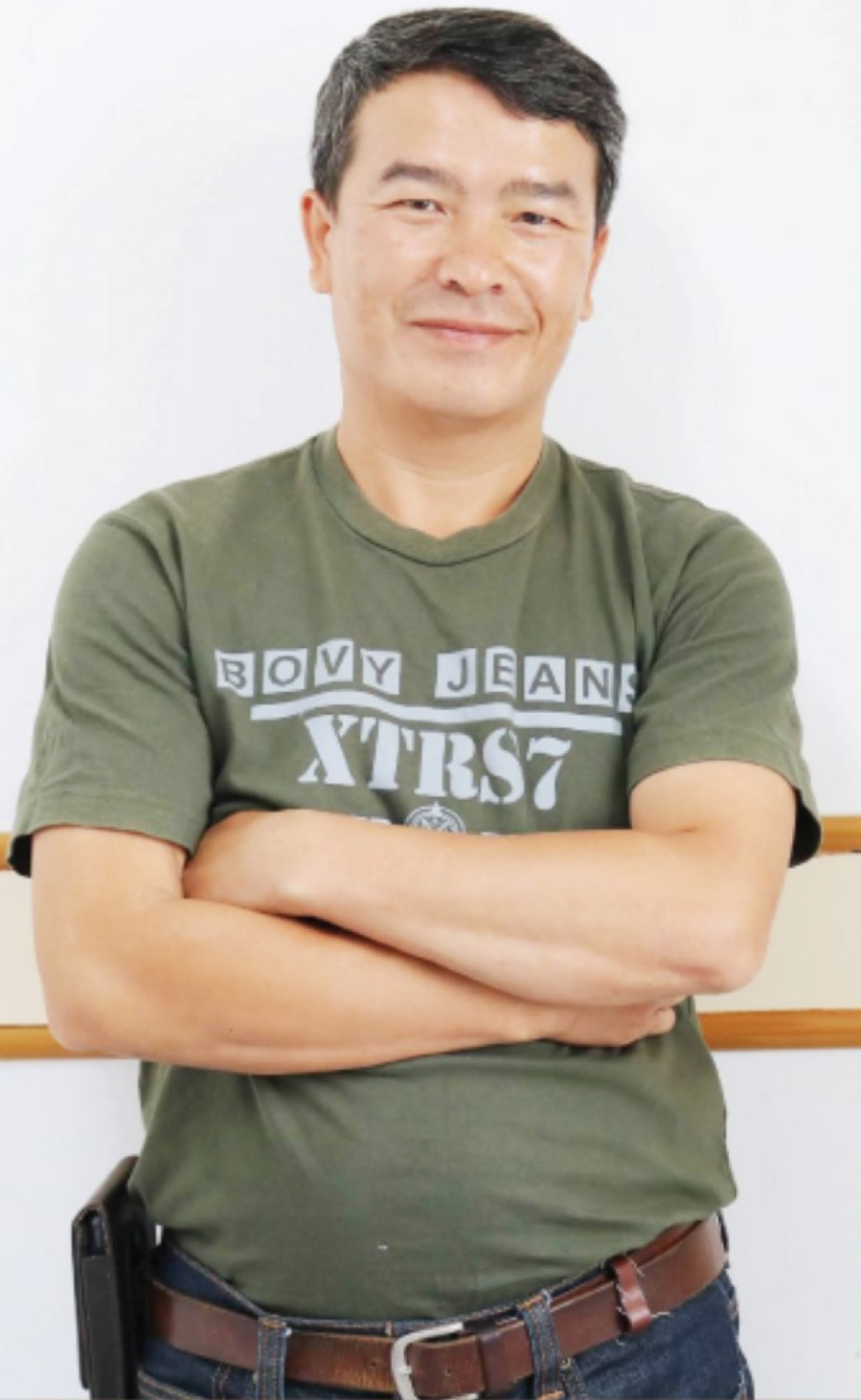
ขอขอบคุณ : คุณชการ สองอารยา