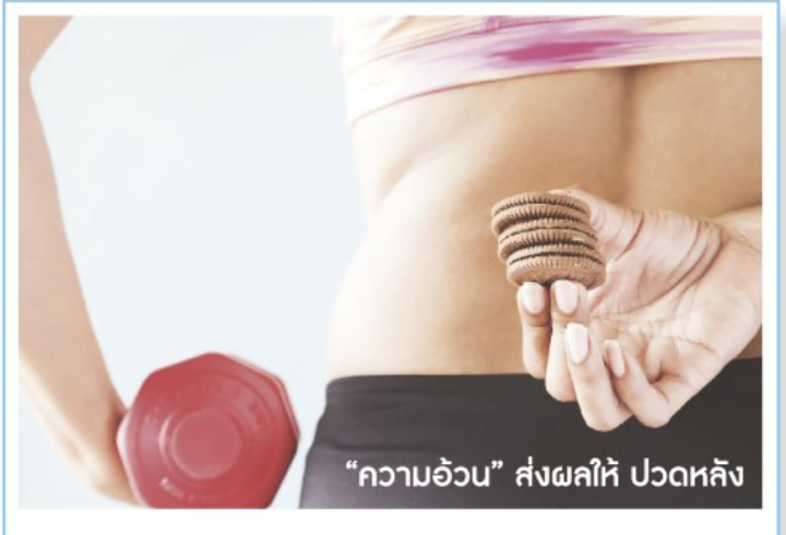
“ความอ้วน” ส่งผลให้ ปวดหลัง